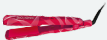
Piastra ai Minerali Bio Ionic RTX-450

20 min - Anti crespo 30 min - Liscio perfetto